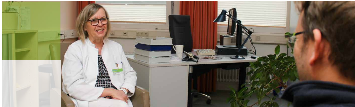
CA = Chefarzt | OA = Oberarzt

Folgende Fachrichtungen sind dabei involviert: